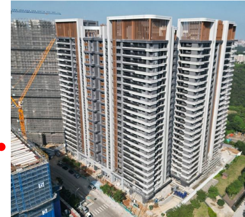
富宇建設合建分售(土地4,047坪)