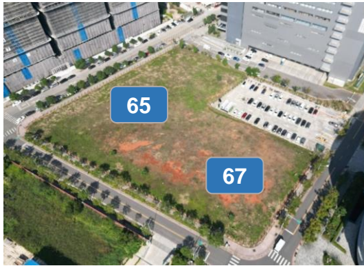
65地號(含55-7、55-1)2,635坪、 67地號1,637坪·共4,272坪