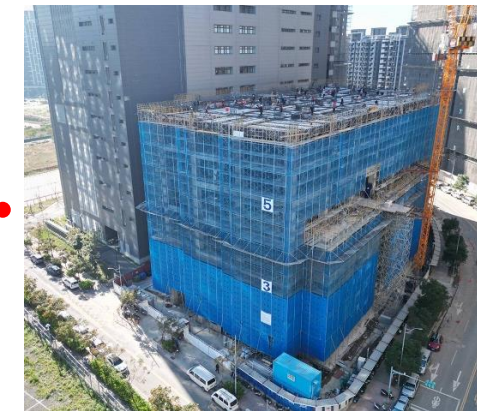
興建中二期廠辦(土地1,926坪)